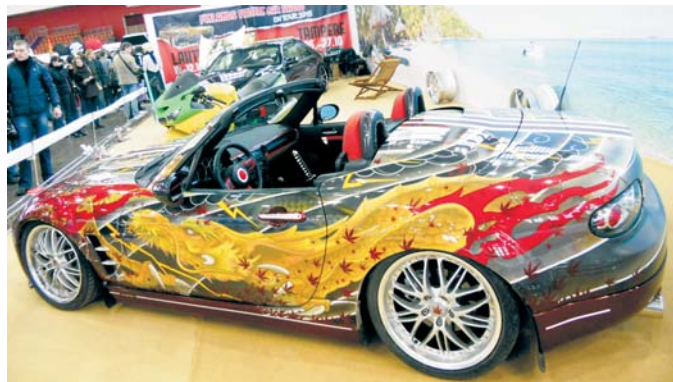
В тюнинг-шоу «Стиль и Драйв» ОБЛИК СОЗДАЕТ ВОСПРИЯТИЕ были заявлены более 20 тюнингованных моделей.

Открыл выставку пробег «Мир Lada». В колонне стартовали около 30 автомобилей российского производства. Среди них – легендарные ретро-модели, автомобили