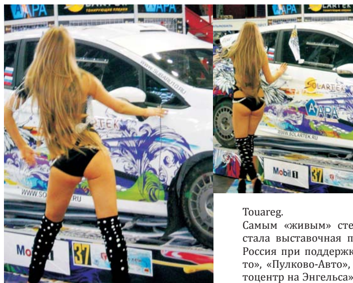
Для эффективной рекламы все средства хороши: на динамичных моделях студии Солартек взгляд посетителей задерживался дольше всего.

спортивным мероприятии в составе ООО «ФОЛЬКСВАГЕН Груп Рус» – автомобильного партнера игр. Многих посетителей наверняка впечатлила модель белого цвета (candy-white) со специальным олимпийским значком. Хочу напомнить нашим читате-