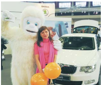
Рядом с удивительно дружелюбным и активным Йети рады были сфотографироваться многие (независимо от возраста, пола и социального статуса).

Франции, а производится в испанском городе Виго. Как было отмечено, автомобиль адаптирован к российским условиям эксплуатации. Citroën C-Elysée имеет усиленную конструкцию кузова, двойные уплотнители дверей и дополни-