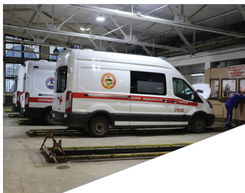
ВСЕГДА СПЕШАТ НА ПОМОЩЬ