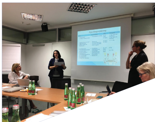
РАЗВИТИЕ ПРЕДПРИНИМАТЕЛЬСКИХ КОМПЕТЕНЦИЙ