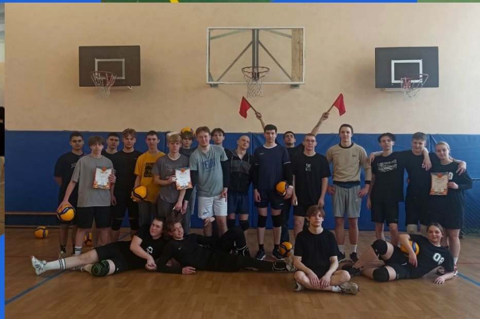
Открытый турнир ССУЗы-М