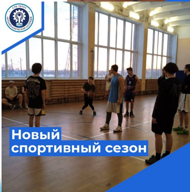
Новый спортивный сезон