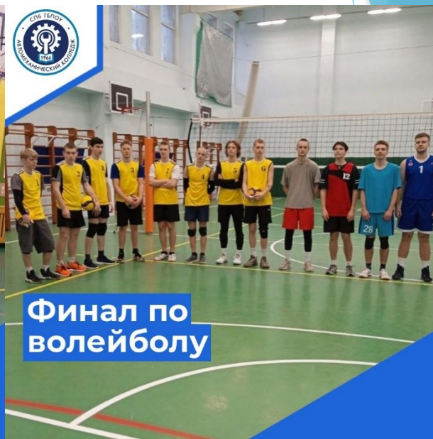
Финал по волейболу