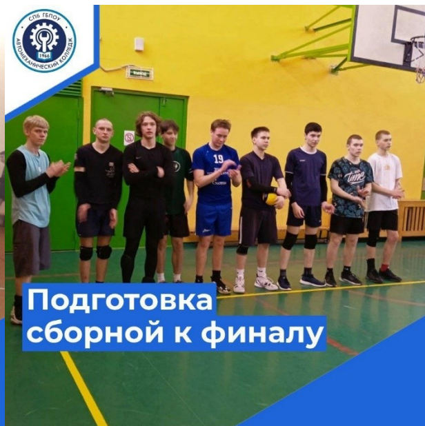
Подготовка сборной к финалу