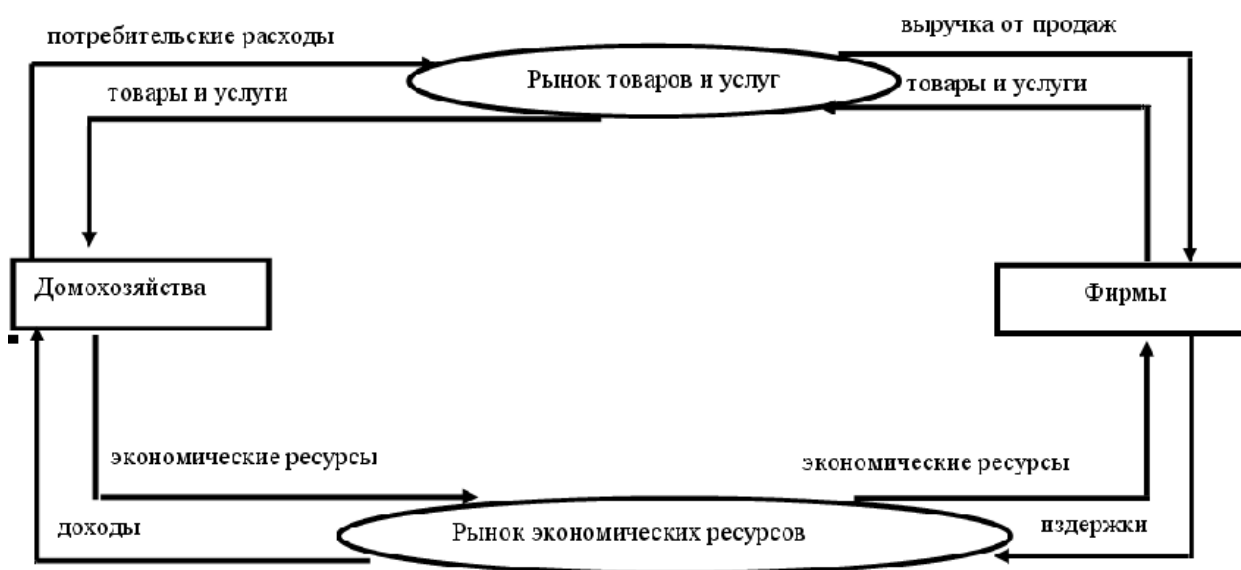
Диаграмма кругооборота потоков в экономике

Характеристика потоков расходов и доходов.