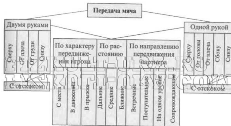
Классификация способов передачи мяча