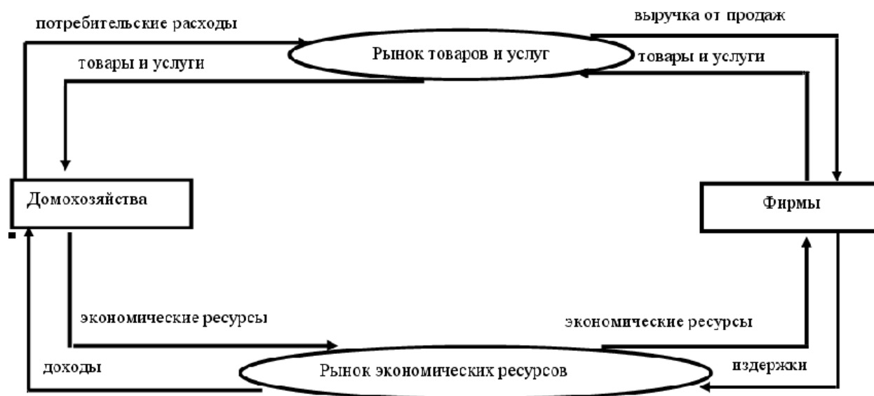
Диаграмма кругооборота потоков в экономике