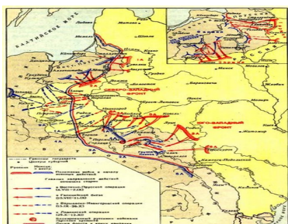
Карта 1. Военная кампания 1914 г. На Восточном (Русском) фронте