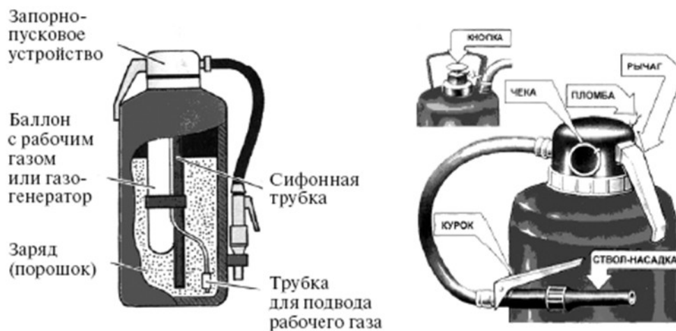
Рис. 26. Порошковый огнетушитель со встроенным газовым источником давления ОП-5