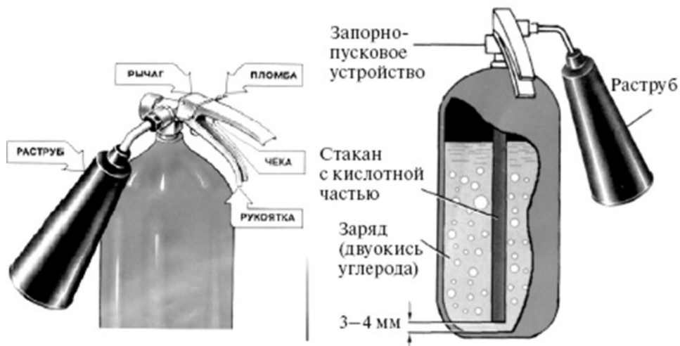
Рис. 2. Углекислотный огнетушитель ОУ-2

У огнетушителя ОУ-2 раструб присоединен к корпусу шарнирно. Кроме того, огнетушитель имеет предохранительное устройство мембранного типа, которое автоматически разряжает баллон огнетушителя при повышении в нем давления сверх допустимого.