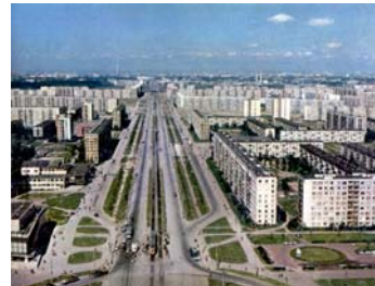
Санкт-Петербург — Трамвайные линии Бухарестская улица Здесь была деревня Купчино. Из комплекта открыток «Город-герой Ленинград». Издательство «Плакат», 1980 г.

Отметим лишь некоторые события в жизни нашего района, сыгравшие опре-