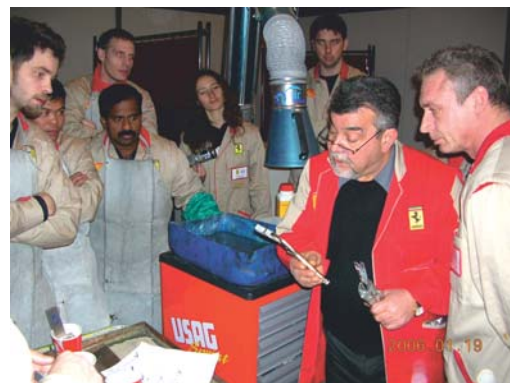
«Тренинг Феррари в Италии: тренируемся на алюминиевых пластинах для сдачи экзамена».

цией, какие мероприятия планируются в ближайшее время?