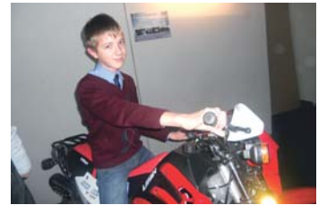
Не удивительно, что стенд АМПЛ-77 стал самым посещаемым.

Мы рассчитываем, что по итогам данного мероприятия будут конкретные отклики от учащихся. А дальше уже будем работать со школами, анализировать результаты. Конечно, мы ни в коем случае не гарантируем, что ребята, посетившие ярмарку профессий, после 9 класса покинут стены школы. Это совершенно не обязательно. Возможно, после 11 класса у них появится интерес к какой-то определенной профессии. Главное, так