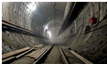
Перегонный тоннель Международная - Бухарестская (I-ый путь).

В годы Великой Отечественной войны деревня Купчино эвакуируется, а линия