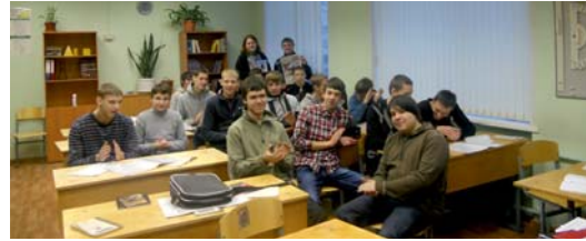
Лавры пожинать всегда приятно.

тель, первым приславший заполненный кроссворд по электронной почте. Им стал